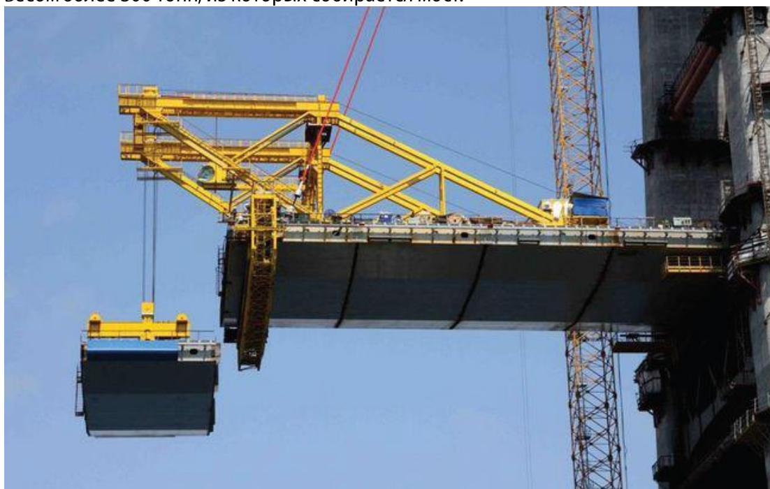
Рис.1 Специально спроектированный «Мостовиком» кран установлен на центральной панели пролета моста.

Кран, разработанный компанией «Мостовик», используется для перемещения панелей длиной 12м, используемых в строительстве вантового моста соединяющего материк и остров Русский. Уникальный кран использует преобразователи частоты «Данфосс», которые управляют мотор-редукторами Bauer, и перемещает панели весом более 300 тонн, из которых собирается мост.