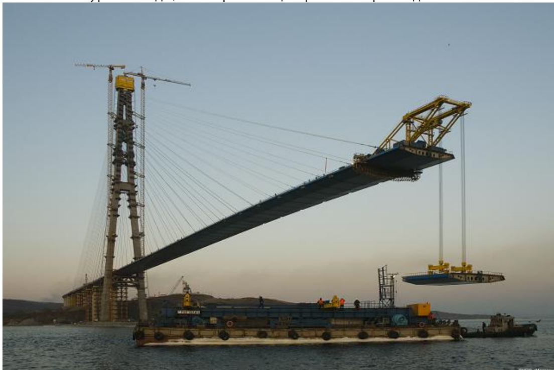
Рис.3 Панели для моста доставлялись на баржах, которые с помощью спутниковой связи ГЛОНАСС точно позиционировались под местом их подъема

Построенный мост должен был превзойти мировые рекорды, поднявшись более чем на 70 м выше уровня воды, имея при этом центральный пролет длиной 1104 м.