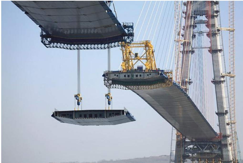
Рис.2 Кран «Мостовика» поднимает панели весом более 300 тонн на высоту 70 м

Одним из требований при строительстве была достаточная высота моста, так как Владивосток является крупным портом и к нему подходят крупные суда. Плюс ко всему в месте строительства пролив имел ширину, достигающую 1460 метров. Из всех этапов строительства моста наиболее сложным являлось строительство центрального пролета, который состоял из 103 панелей, каждая длиной 12м и 26 м в ширину.